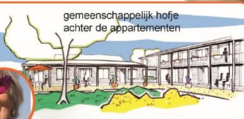
gemeenschappelijk hofje achter de appartementen