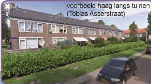
voorbeeld haag langs tuinen (Tobias Asserstraat)