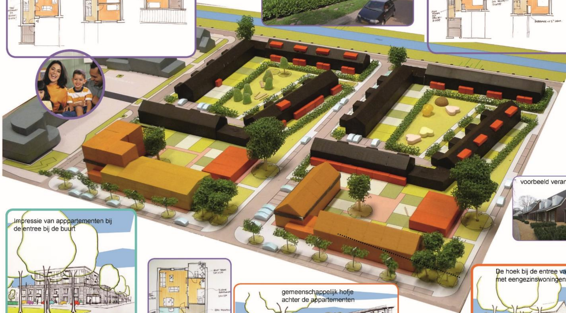
Impressie van appartementen bij de entree bij de buurt