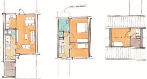
voorbeeld ontdupekte eengezinswoning